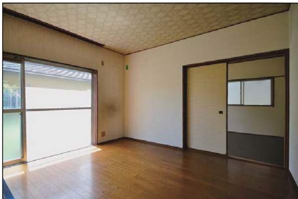
【現地内観（リビング）】